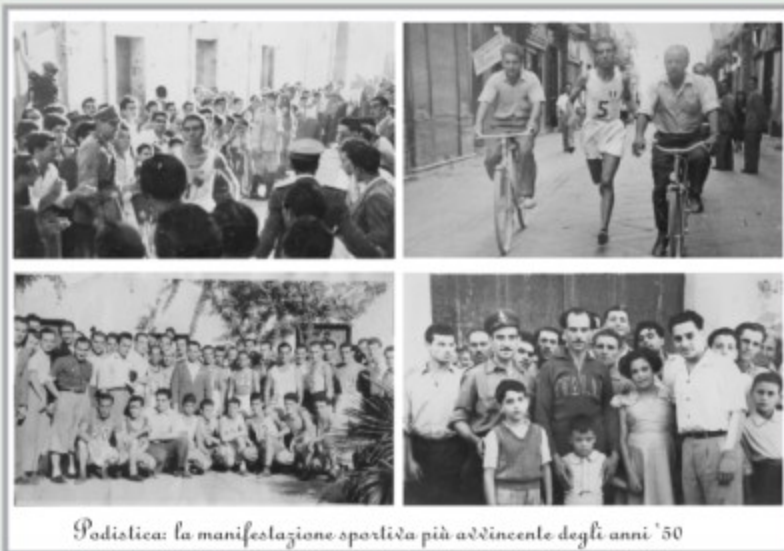
Podistica: la manifestazione sportiva più avvincente degli anni '50