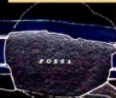
Fornace Etrusca (VI-V secolo a.C) ritrovata nel 1981 in Viale Europa