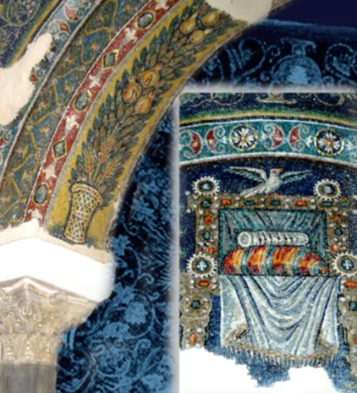
Mosaici della cappella di Santa Matrona (V-VI secolo d.C.)