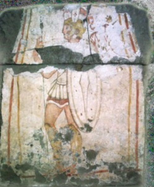
Necropoli Sanmitica: tomba dipinta (IV-III secolo a.C.) ritrovata nel 1970 in viale Trieste