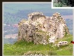
Chiesa di San Nicola