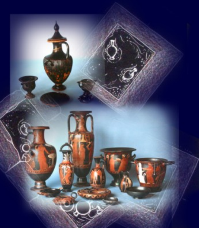
Necropoli Sannitica: vasellame (IV-III secolo a.C.) ritrovato nel 1970 in viale Trieste