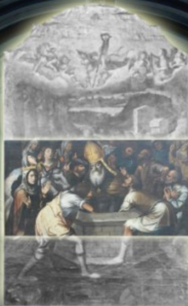
Il Miracolo di San Prisco, dipinto di autore ignoto (XVIII secolo) Chiesa Santa Croce