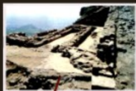
Tempio di Giove