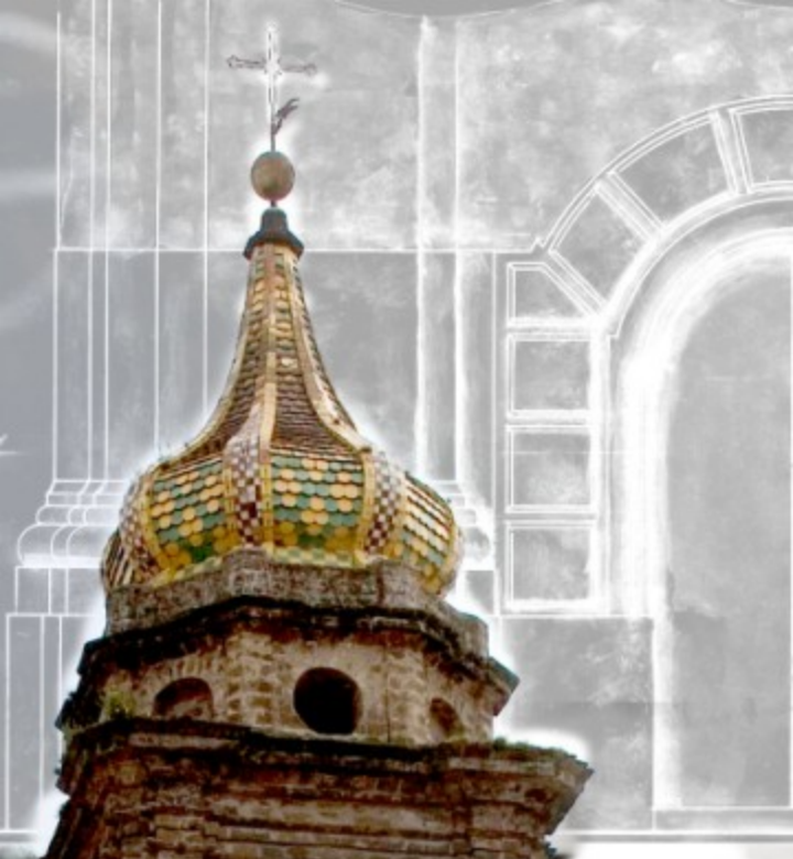
Campanile di scuola Vianvittelliana (XVIII secolo)