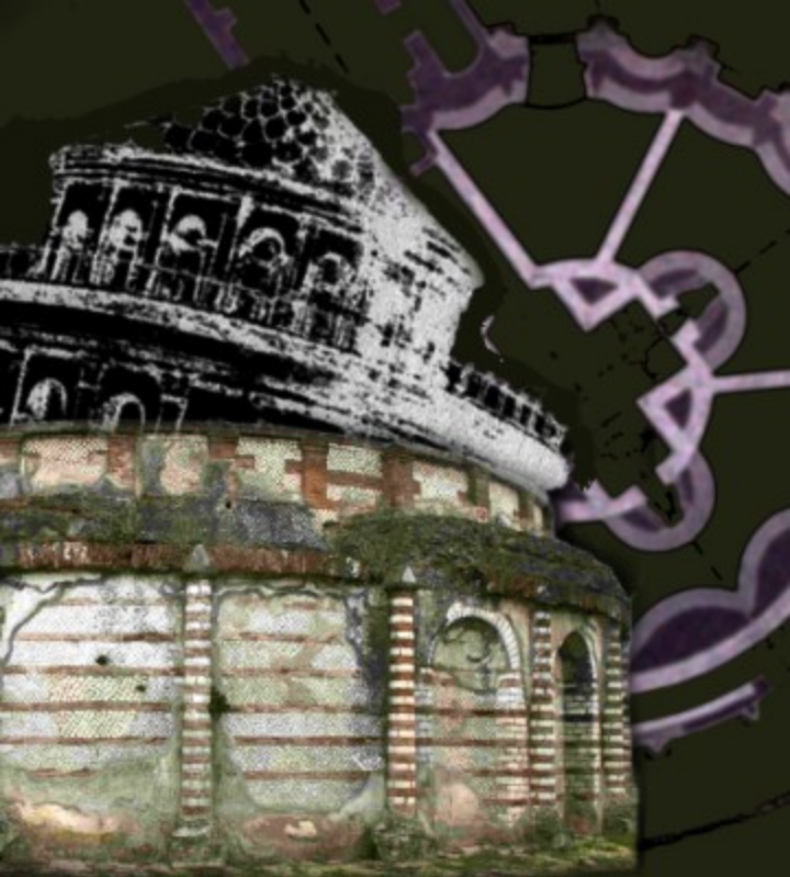
Carceri Vecchie - monumento funerario (I secolo d.C.) in via Appia