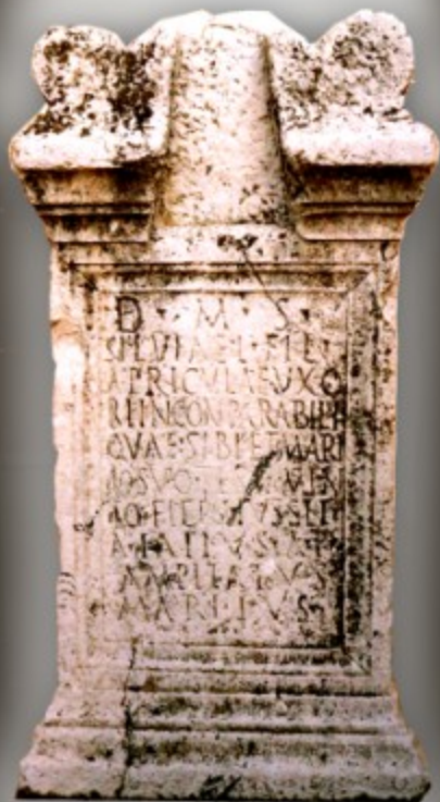
Ara funeraria di Silvia Apricula (II secolo d.C.) trovata in via Dante