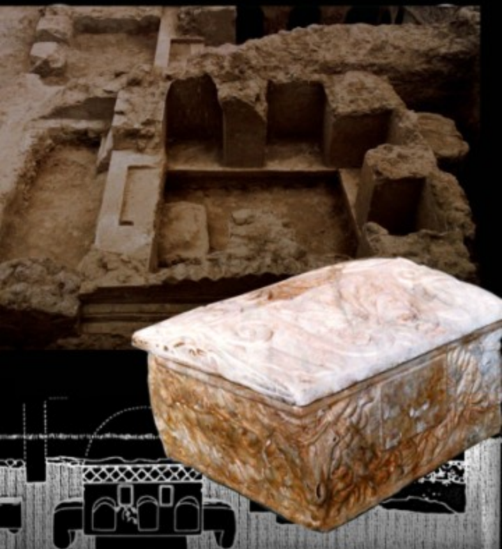
Necropoli Romana: Domus e Urna (I secolo a.C.) ritrovate in località Boccardi e in viale Trieste